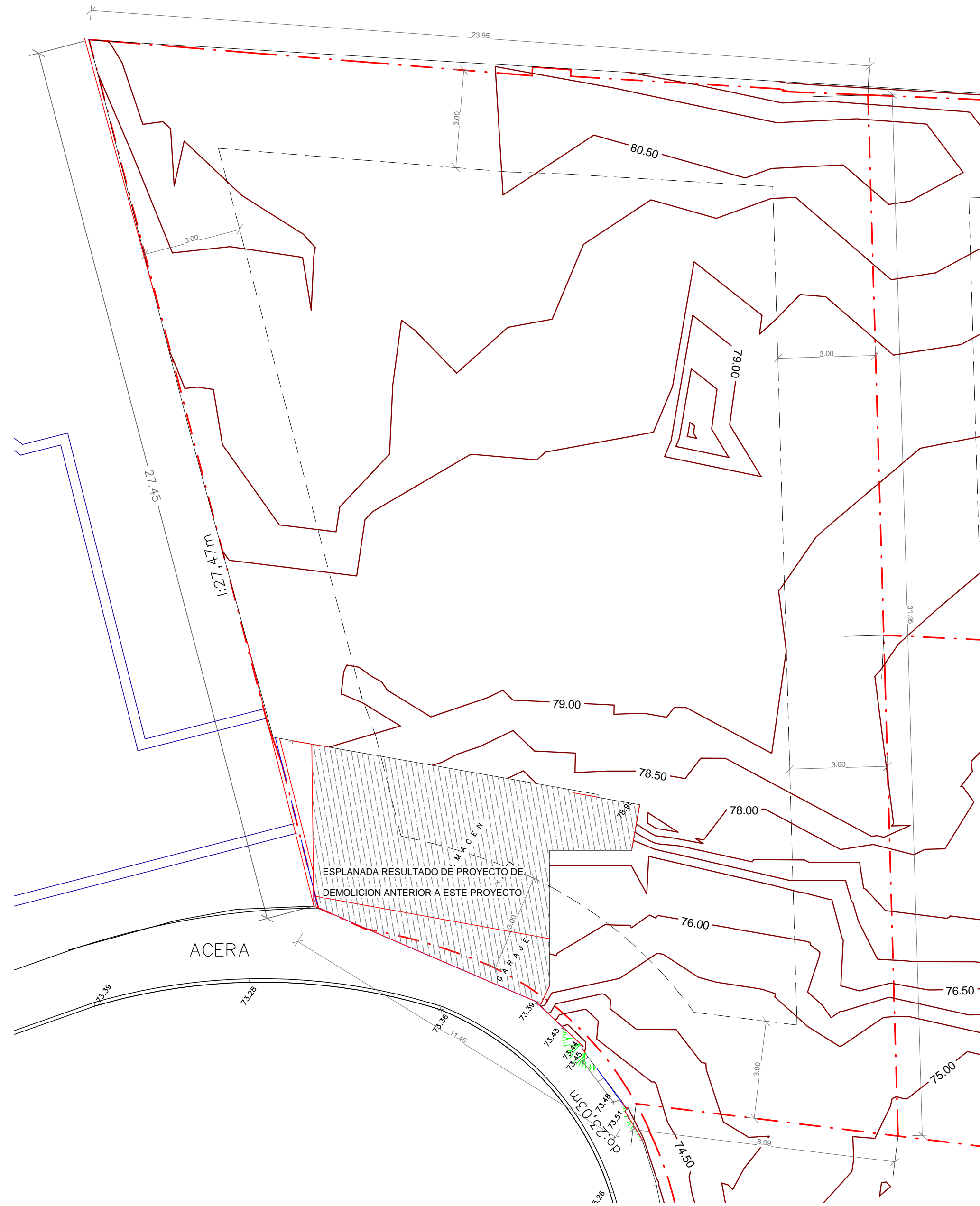
2 01 SOLAR Y TOPOGRAFICO (A) ACTUAL A2 ESCALA 1 : 100

PARCELA SITUADA EN CALLE JOSE SAMPOL, 11 T.M. DE PALMA TOTAL SUPERFICIE DE PARCELA 601.44 m²